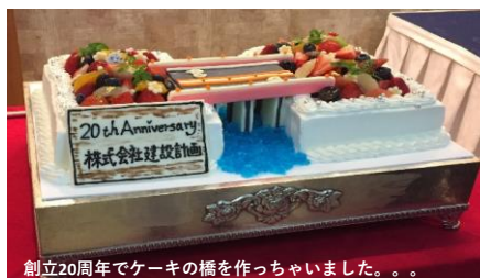
創立20周年でケーキの橋を作っちゃいました。。。。